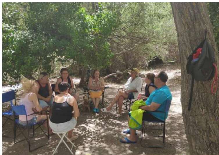
Paella Familiar organizada en colaboración con la Asociación de Adopción y Acogimiento AFAM